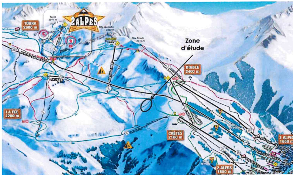
Fig 1. Localisation de la zone du projet

Projet de reprofilage de la piste « Thuit 2 » dans la station Les 2 Alpes (38), avec la mise en place de remblais pour corriger le devers de la piste.